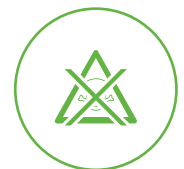
Produsert av miljøvennlige og resirkulerbare materialer