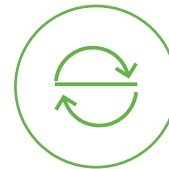
Mulighet for åpning av luke med pedal