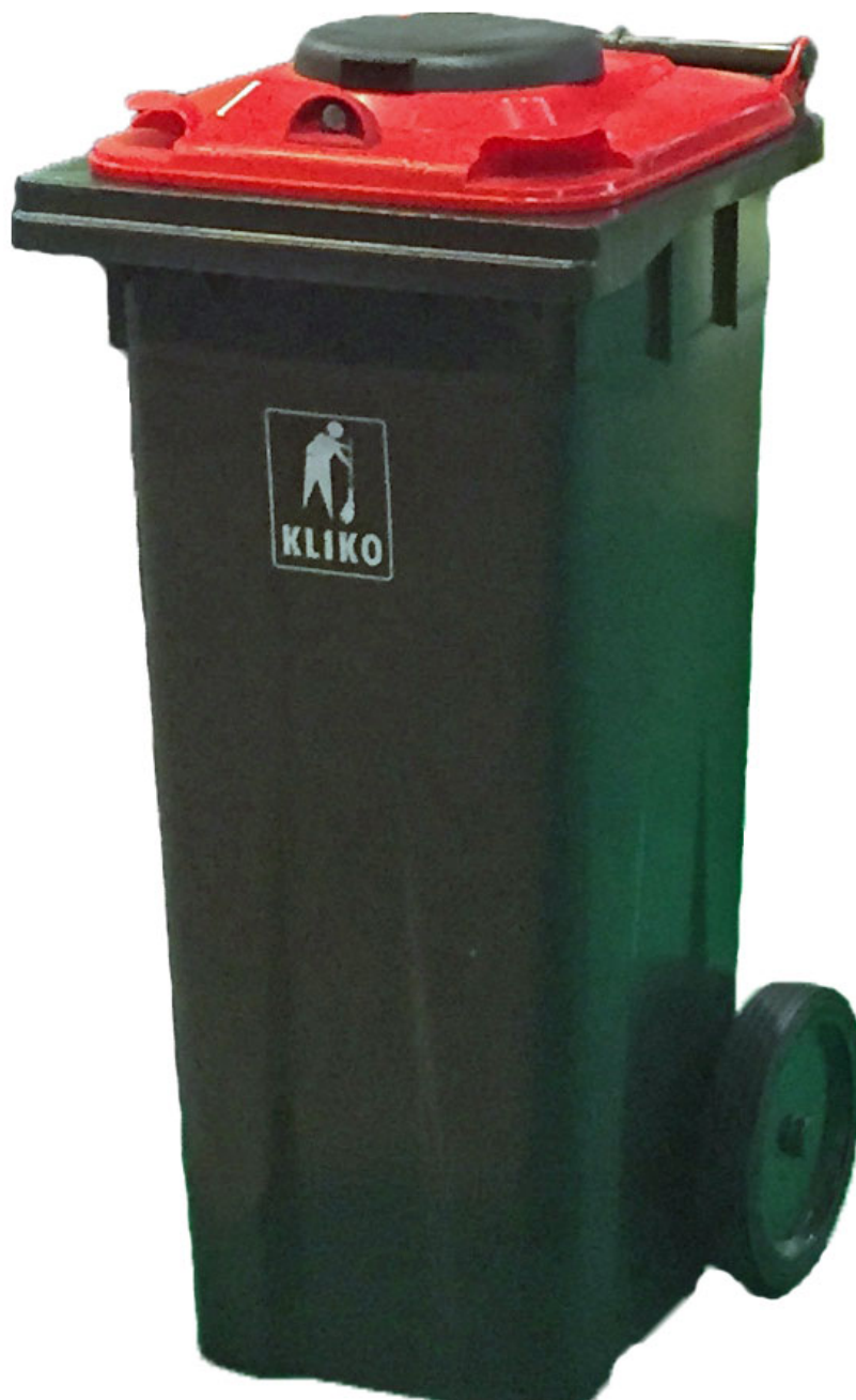
Avbildet 140L. Kan også leveres på 240L

Løsningen er også enkel å montere siden hullåpning og innfestingspunkter på beholder og lokk er forhåndsboret.